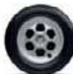
ENJOLIVEUR GRIS (SÉRIE)