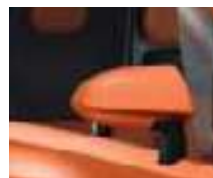
SELLERIE ROUGE RETROVISEURS ROUGES**