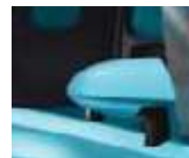
SELLERIE BLEUE RETROVISEURS BLEUS**