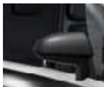
SELLERIE NOIRE RETROVISEURS NOIRS**