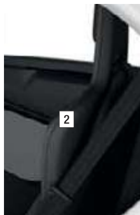
SIÈGE NOIR (SÉRIE)