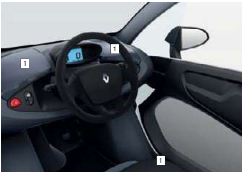
NOIR/SANS STRIPING (SÉRIE)