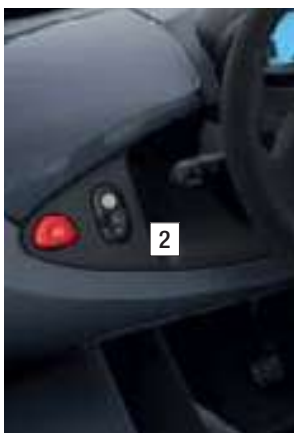
ELLIPSE NOIRE (SÉRIE)