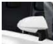
SELLERIE NOIRE RETROVISEURS BLANCS**